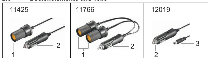
Fig.1: Bedienelemente und Teile