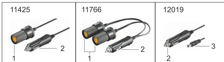
Fig.3: Operating elements