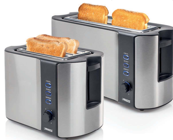
Toaster / Long Slot Toaster 01.142352.01.001 / 01.142353.01.001

PARTS DESCRIPTION / ONDERDELENBESCHRIJVING / DESCRIPTION DES PIÈCES / TELEBESEHRIBUNG / DESCRIPCIÓN DE LAS PIEZAS / DESCRIÇÃO DOS COMPONENTES / DESCRIZIONE DELLE PARTI / BESKRIVNING AV DELAR / OPIS CZĘŚCI / POPIS SOUČÁSTÍ / POPIS SOUČASTI / ОПИСАНИЕ ЗАПЧАСТІ