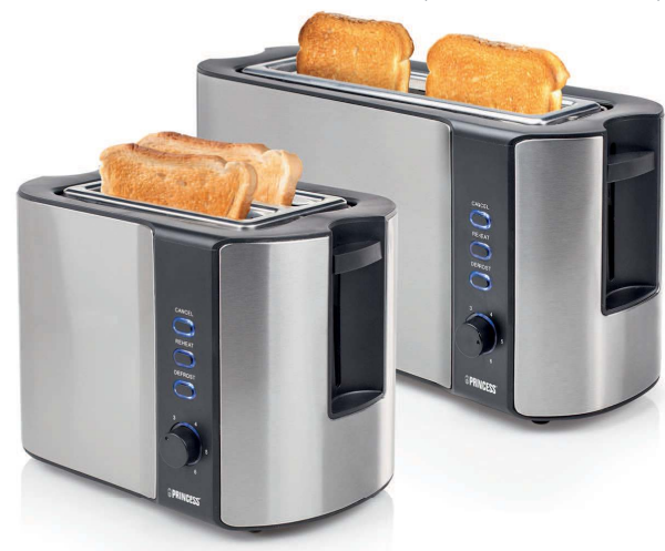
Toaster / Long Slot Toaster 01.142352.01.001 / 01.142353.01.001

PARTS DESCRIPTION / ONDERDELENBESCHRIJVING / DESCRIPTION DES PIÈCES / TEILEBESCHREIBUNG / DESCRIPCIÓN DE LAS PIEZAS / DESCRIÇÃO DOS COMPONENTES / DESCRIZIONE DELLE PARTI / BESKRIVNING AV DELAR / OPIS CZĘŚCI / POPIS SOUČÁSTI / POPIS SUČASTI / ОПИСАНИЕ ЗАПЧАСТИ