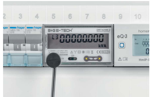
Montage an einem Stromzähler

Anschließend wird der Sensor mit der Schnittstelle verbunden und über die App ins Smart Home integriert – fertig!