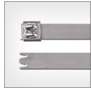
Edelstahlkabelbinder, unbeschichtet, MBT_XHS.

i Unterstützt Qualitätsprozesse in der Lebensmittelverarbeitung wie z. B. HACCP.