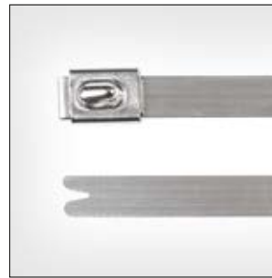
Edelstahlkabelbinder, unbeschichtet, MBT_SS, MBT_HS.