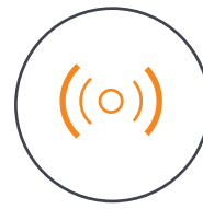
Dual Noise Sensor