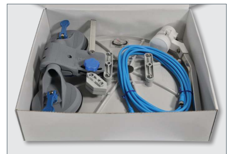
Kompakte Bauweise, einfach zu Verstauen