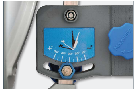
Sehr gut ablesbare Elevationseinstellung dadurch einfach einzustellen