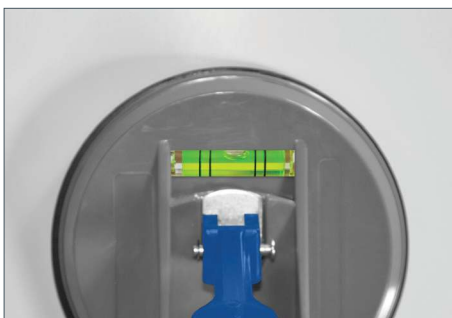
Integrierte Wasserwaage zur einfachen senkrechten Anbringung