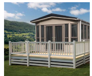
Für alle vertikalen glatten Flächen geeignet