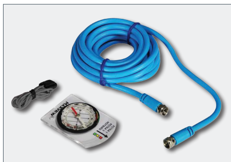
5m flexibles Koaxial Kabel & Sat-Kompass