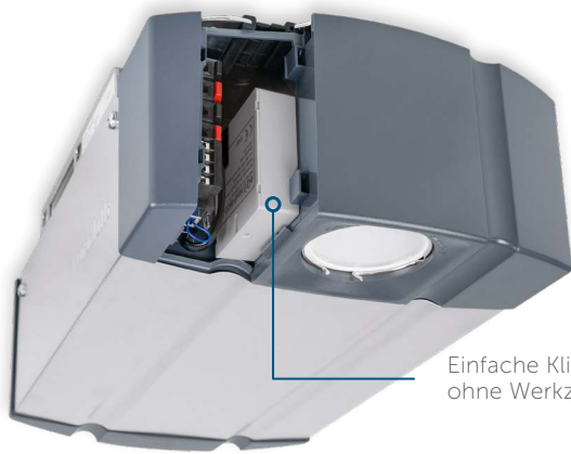
Einfache Klickmontage ohne Werkzeug