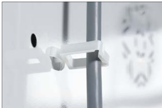
WPC-Kabelhalter mit Steckanker für einzelnen oder mehrere Bündel.