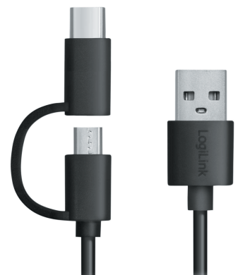
2 in 1 USB-C & Micro-B Kabel enthalten