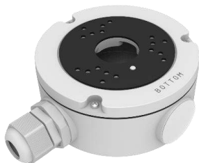
AU1001 (optionales Zubehör)