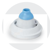
Nasenduse adapter ab 12 Jahren