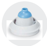
Nasenduse adapter von 3 bis 12 Jahren