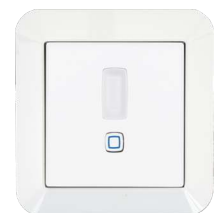
GIRA Standard 55