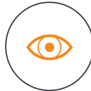
Drucksensor zur Erkennung von Teppichen