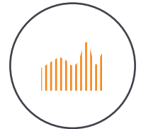
Multi Level Mapping