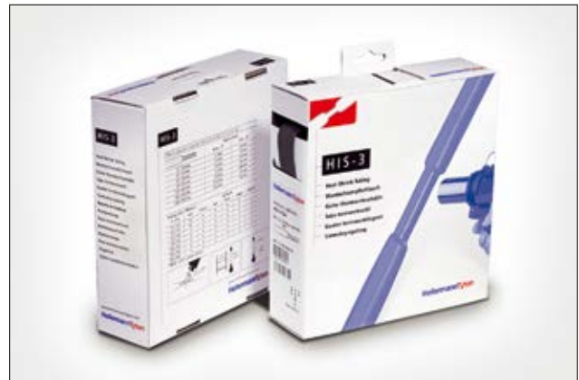
HIS-3 ist selbst bei großen Durchmesserunterschieden geeignet.