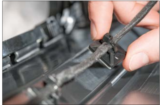
Quadratische SolidTack MB Sockel - schraubbar, selbstklebend - geeignet für eine Vielzahl von Anwendungen wie die Befestigung von Kabeln in der Automobiltechnik.