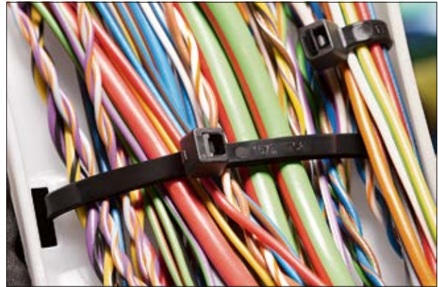
Kabelbinder der T-Serie sind universell einsetzbar (PA66).