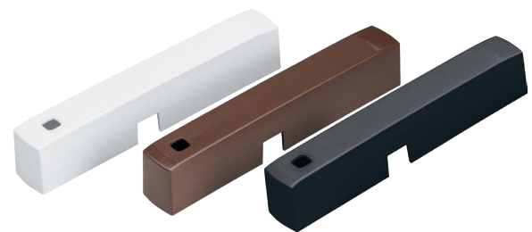
Farbvarianten in Weiß, Braun und Anthrazit