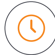
Bis zu 60 Minuten Laufzeit