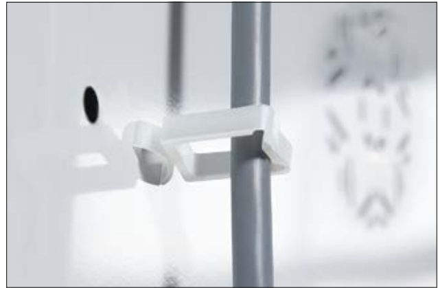
WPC-Kabelhalter mit Steckanker für einzelnen oder mehrere Bündel.