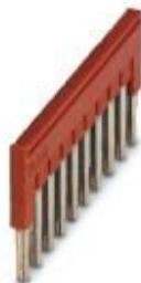
Steckbrücke, Rastermaß: 5,2 mm, Länge: 22,7 mm, Breite: 50,6 mm, Polzahl: 10, Farbe: rot

Bitte beachten Sie, dass die hier angegebenen Daten dem Online-Katalog entnommen sind. Die vollständigen Informationen und Daten entnehmen Sie bitte der Anwenderdokumentation. Es gelten die Allgemeinen Nutzungsbedingungen für Internet-Downloads. ( http://phoenixcontact.de/download )