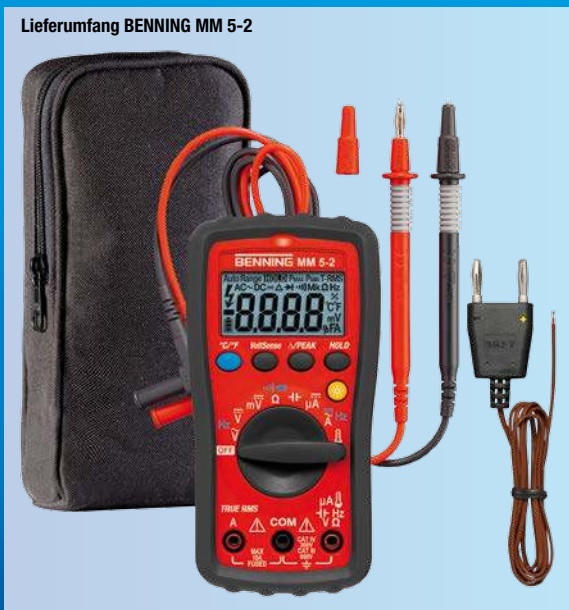
Lieferumfang BENNING MM 5-2