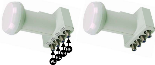
QUATTRO-LNB separate VL - HL - VH - HH Anschlüsse

Achten Sie auf das passende LNB zum Ihrem Multischalter: