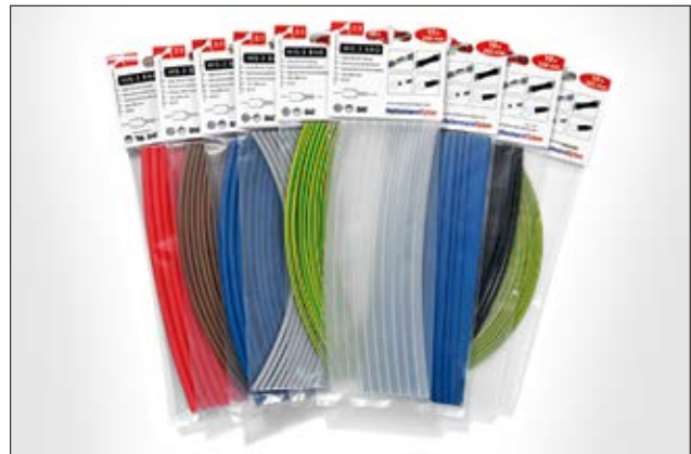
HIS-3 BAG ist in sieben Farben und vier Abmessungen erhältlich.