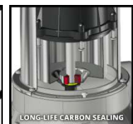
LONG-LIFE CARBON SEALING