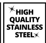
HIGH QUALITY STAINLESS STEEL