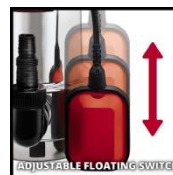
ADJUSTABLE FLOATING SWITCH