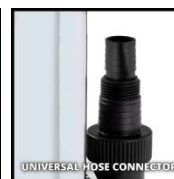
UNIVERSAL HOSE CONNECTOR