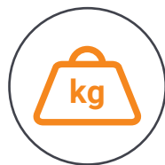
Kompakt und tragbar