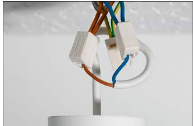
Schnelle Installation von Leuchten mit HelaCon Lux.

Die Ader auf der Ausgangs- bzw. Leuchtenseite kann sehr einfach durch Zusammendrücken des Klemmmechanismus verbunden und genauso jederzeit wieder gelöst werden. Auf dieser Seite können alle Leiterarten geklemmt werden, wodurch sich HelaCon Lux ebenfalls zum Anschluss von Geräten mit flexiblen Zuleitungen wie Rollosteuern, Ventilatoren oder ortsveränderlichen Antrieben eignet.