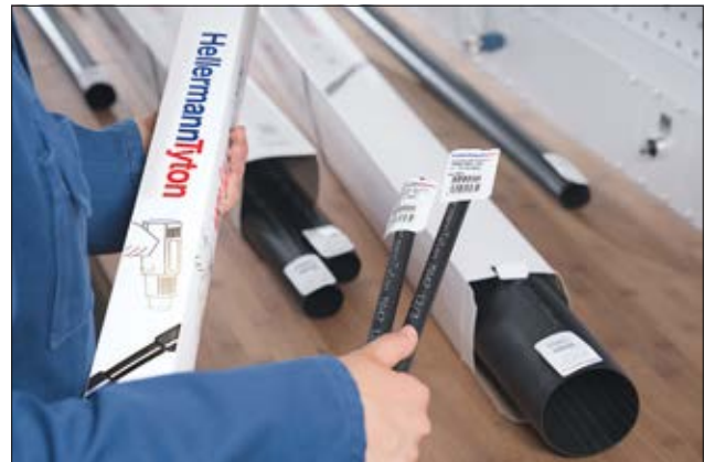
TREDUX MA47 im praktischen Display-Karton.