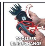
TOOLLESS BLADE CHANGE