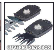
COVERED GEAR BOX