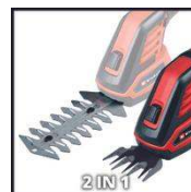
2 IN 1