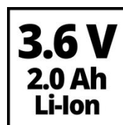
3.6 V 2.0 Ah Li-Ion