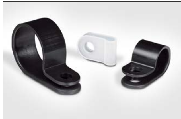
Die Kunststoffschellen der HP-Serie sind in verschiedenen Größen erhältlich.